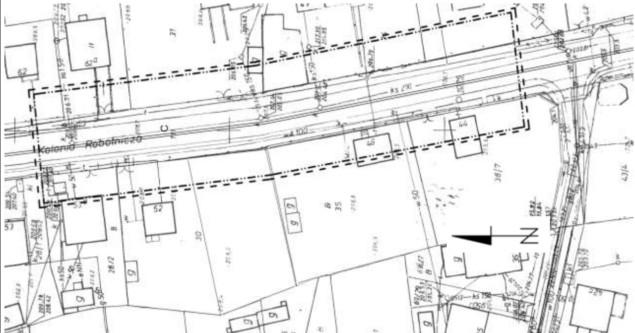
RYSUNEK 1. DOTYCZY INWESTYCJI LINIOWYCH